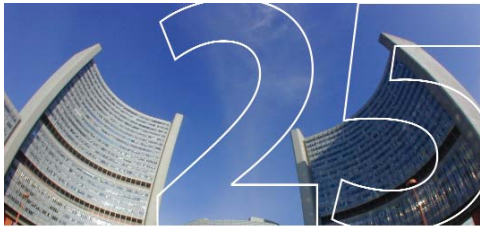
25 years Vienna International Centre